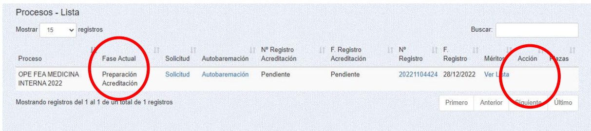
Imagen 3 Ejemplo de Lista de procesos con un proceso que no está en Acreditación (ojo está en "preparación de acreditación", eso es que saldrá pronto pero AÚN NO)

SI NO ESTÁ EN FASE DE ACREDITACIÓN, no hay nada que seleccionar. SOLO LOS REQUERIDOS TIENEN ESTAS OPCIONES.