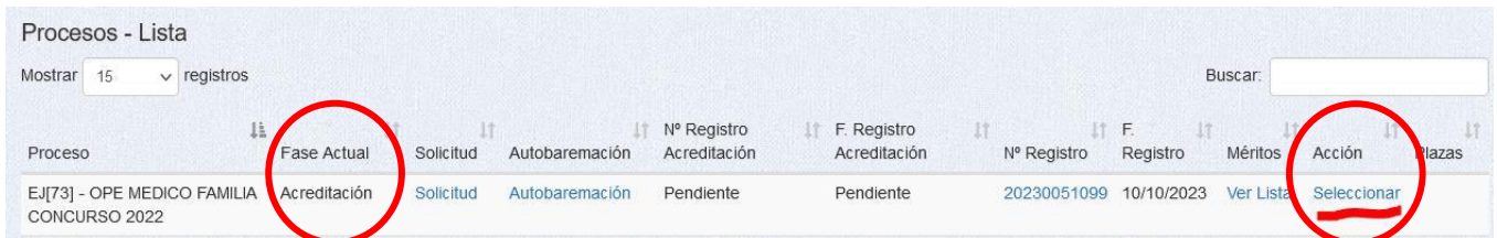
Imagen 2: Ejemplo de un proceso (ficticio) en fase de acreditación: la primera columna "Fase Actual" dice "Acreditación" y la columna "Acción" muestra un acceso activo "Seleccionar"

Ve a Procesos-> Mis procesos (ojo. Solo "MIS PROCESOS") y se abrirá la pantalla de selección de procesos. Aparece una lista de los procesos (si solo estás inscrito en uno, pues en uno), donde se puede consultar en diferentes columnas la fase en que se encuentra el proceso, la fecha de solicitud, la autobarefacción, la fecha de registro... y muy importante: si el proceso está en fase de "Acreditación" , en cuyo caso lo mostrará como tal y la columna Acción mostrará un enlace activo "Seleccionar". (Imagen 2) Desde él ya pasas a la pantalla de Méritos.