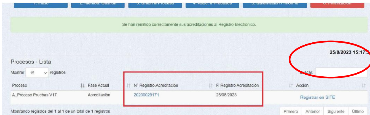
Imagen 9. Éxito en la remisión. Observar que sigue abierta la posibilidad de volver a registrar en SITE.

Sirve si tienes alguno previo pero certificado genérico (es decir a instancia de interesado, no que indique que es para un proceso concreto, OPE, bolsa, etc ), sino tienes que pedirlo al Servicio de Personal de cada Área ( MIRA EL ANEXO I DE ESTE TUTORIAL )